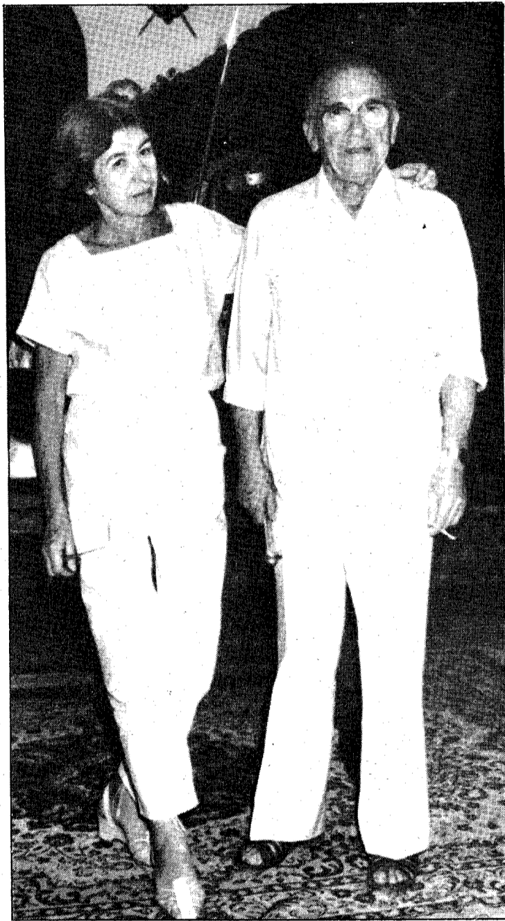
Santiago Carrillo con su esposa, en el «hall» del hotel de Playa del Inglés

«Nunca he creído en el cambio prometido por el PSOE, ni que fuese a sacarnos de la OTAN»