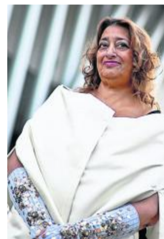
Hadid, en mayo de 2010 en Roma.

cios que estaban por llegar. Cuando a los 54 años obtuvo el Pritzker, que nunca hasta entonces había reconocido el trabajo de una mujer, Hadid lo recibió como un impulso para poder levantar edificios aún más ambiciosos.